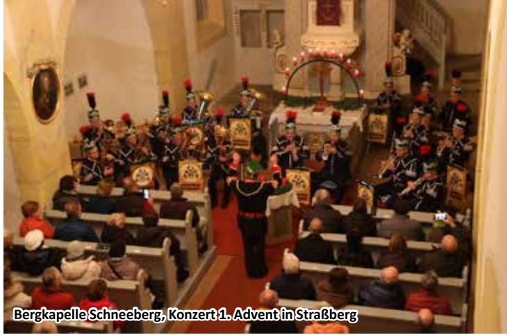
Bergkapelle Schneeberg, Konzert 1. Advent in Straßberg