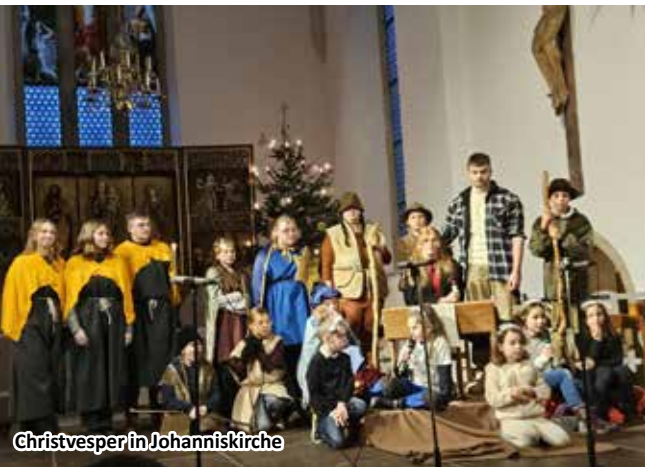
Christvesper in Johanniskirche