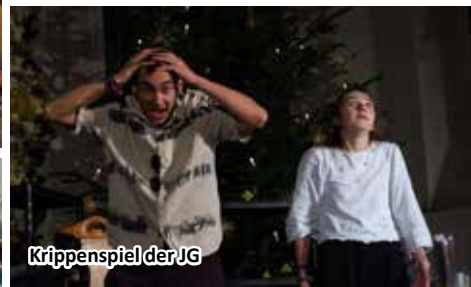
Krippenspiel der JG