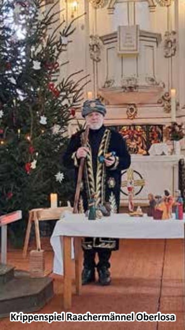
Krippenspiel Raachermännel Oberlosa