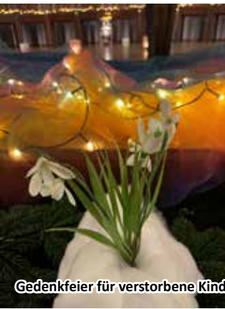
Gedenkfeier für verstorbene Kinder in der Markuskirche