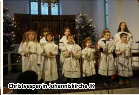
Christvesper in Johanniskirche JK